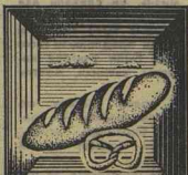
Рис. В. МАШАТИНА

Конечно, проблемы, над которыми сегодня работают сотрудники десятков институтов, выглядят намного сложнее. Но хочется, чтобы было поменьше плачевного, чтобы новосёлам 1985 или 1990 года жилось хорошо на сибирской земле, уже сегодня решается много важных задач.